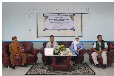
Gambar 2. Narasumber oleh BI