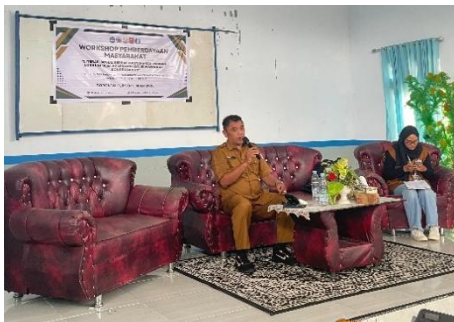
Gambar 3. Narasumber Oleh Dinas Pemberdayaan Masyarakat dan Desa Kab. Bone Bolango