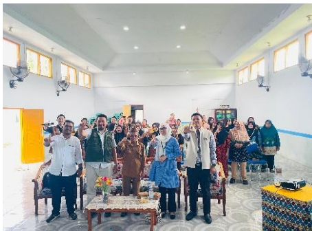
Gambar 1. Pembukaan Kegiatan

Secara keseluruhan, workshop ini berhasil mencapai tujuan awalnya, yaitu memperluas wawasan masyarakat mengenai pentingnya literasi sosial dan pengembangan produk pangan lokal. Kegiatan ini juga membuka peluang kerja sama berkelanjutan antara masyarakat, aparat desa, mahasiswa, dan instansi terkait. Ke depan, workshop ini diharapkan menjadi titik awal bagi terbentuknya kelompok usaha berbasis pangan lokal yang mandiri dan berdaya saing, serta mampu memberikan kontribusi nyata bagi ketahanan pangan dan perekonomian Desa Boludawa.