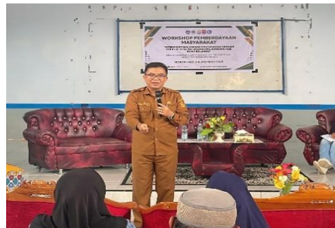
Gambar 4. Narasumber Oleh Dinas Koperasi dan UMKM Kab. Bone Bolango