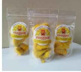
Gambar 5. Diversifikasi Produk Olahan Jagung