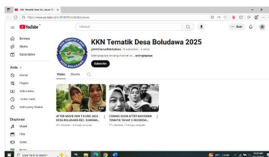
Gambar 5. Channel Youtube KKN Tematik

https://www.youtube.com/@KKNTematikBoludawa