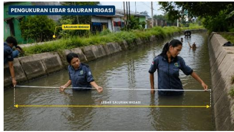
Gambar 3. Pengukuran Lebar Saluran