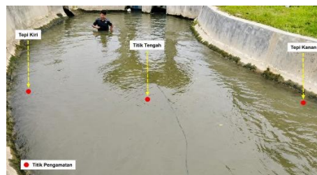
Gambar 5. Penentuan Titik Pengamatan