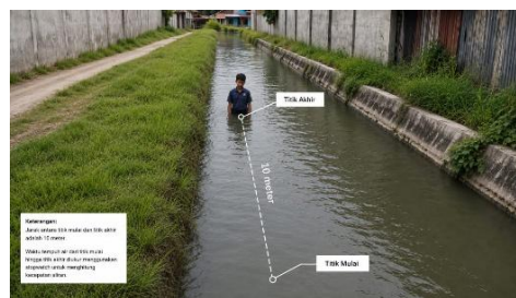
Gambar 2. Penentuan Jarak

Ukur jarak antara titik A dan titik B sejauh 10 meter sebagai jalur lintasan.