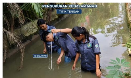
Gambar 4. Pengukuran Kedalaman Sungai

Ukur kedalaman sungai di titik A dan titik B untuk mengetahui profil aliran.